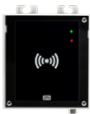
2N® ACCESS UNIT RFID

ord. 916009 (125kHz) ord. 916010 (13.56MHz)