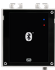
2N® ACCESS UNIT BLUETOOTH

ord. 916009 (125kHz) ord. 916010 (13.56MHz)