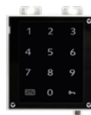
2N® ACCESS UNIT TECLADO NUMÉRICO