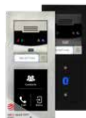
2N® IP Verso