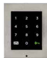
2N® ACCESS UNIT CLAVIER TACTILE