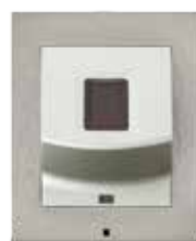
2N® ACCESS UNIT LECTEUR D'EMPREINTES