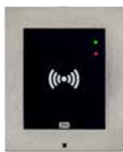
2N® ACCESS UNIT RFID

ord. 916009 (125kHz) ord. 916010 (13.56MHz)