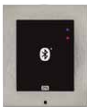
2N® ACCESS UNIT BLUETOOTH

ord. 916009 (125kHz) ord. 916010 (13.56MHz)