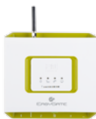
2N® EasyGate PRO

V dnešní době je nevyhnutelnou součástí každého výtahu řešení nouzové komunikace. Zabezpečí spojení mezi výtahovou kabinou a důležitými pracovišti technické podpory, čímž Vám umožní přivolat odbornou pomoc. Technologicky vyspělé výtahové komunikátory od 2N navíc splňují přísné evropské normy (EN 81-28, 70) a díky komfortní obsluze jsou důležitým pomocníkem při vykonávání pravidelného nebo zásahového servisu.