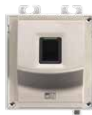
2N® ACCESS UNIT ČTEČKA OTISKŮ PRSTŮ