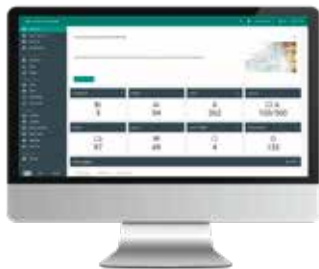
2N® ACCESS COMMANDER