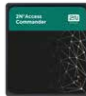
2N® ACCESS COMMANDER BOX