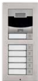
2N® Helios IP Verso