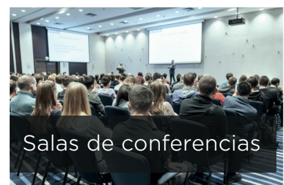
Salas de conferencias