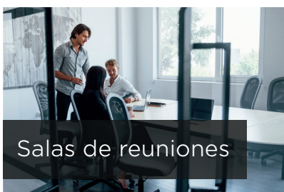
Salas de reuniones