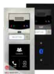
2N® IP Verso